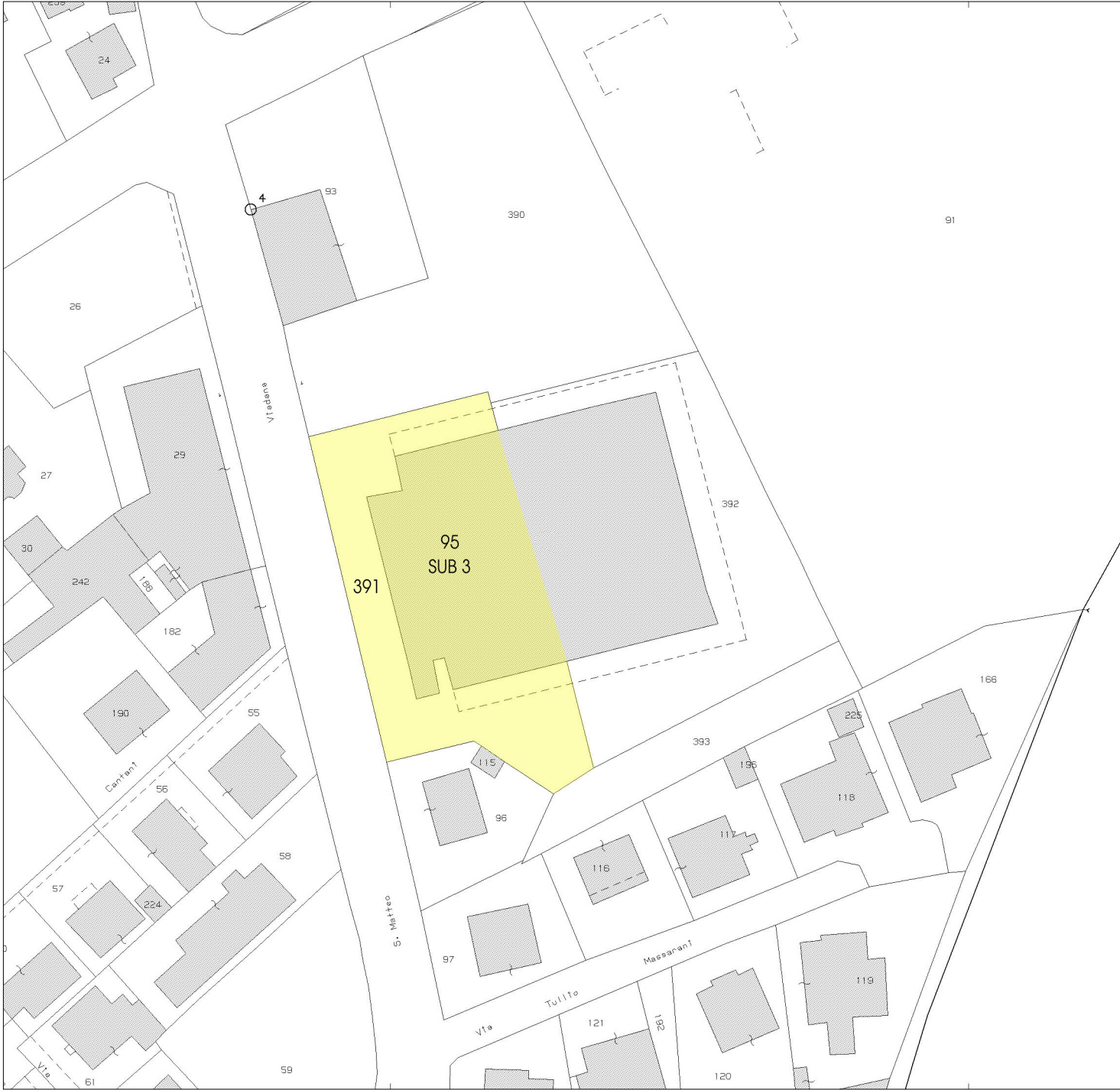
ESTRATTO DI MAPPA FOGLIO 48 MAPPALI 391 e 95 sub.3 SCALA 1:1000