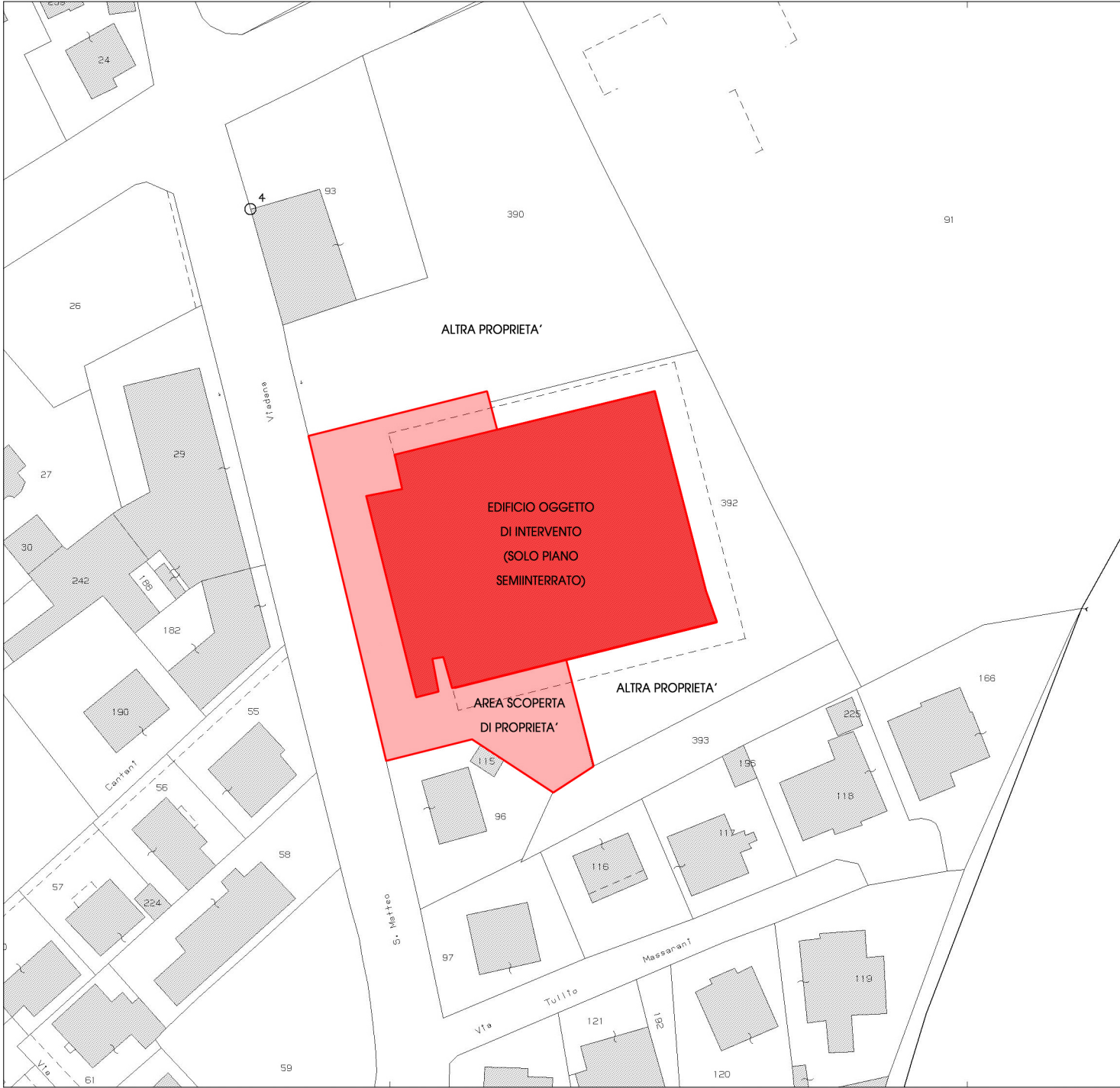
PLANIMETRIA CON INDIVIDUAZIONE DELLA PROPRIETA' SCALA 1:1000